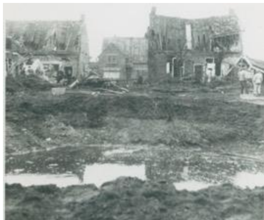
Foto van de krater, die ontstaan is door de V.1-neerstorting op De Akker op 3 maart 1945. De locatie is aan het begin van de Catharinastraat. Het pand in het midden is nu De Kluis.

Dan is het ook 80 jaar geleden dat door het Duitse leger vanaf lanceerplaatsen in Overijssel V.1-vliegende bommen over onze regio naar de haven van Antwerpen werden gelanceerd.