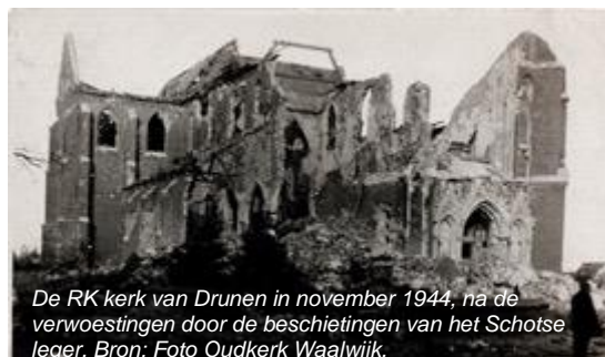
De RK kerk van Drunen in november 1944, na de verwoestingen door de beschietingen van het Schotse leger.

In de volgende uitgave van onze nieuwsbrief komt er meer informatie.