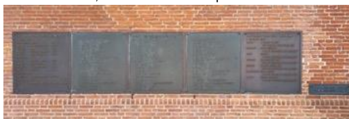
Oorlogsplaqueette 1940 In MEMORIAM 1945 op de gevel van het voormalige gemeentehuis van Drunen.

De dorpen Drunen en Elshout kennen 51 slachtoffers, die in de oorlogsperiode op de dag van hun overlijden ingeschreven stonden in het Bevolkingsregister van de gemeente Drunen. Ook kent Drunen 18 Britse of Canadese militairen die omgekomen zijn bij vliegtuigcrashes of bij schietincidenten. Aandacht zal ook besteed worden aan de 19 Duitse soldaten, die in Drunen en Elshout gesneuveld